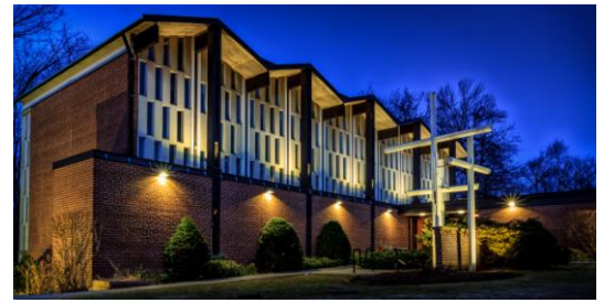
Church of St Luke

Už počas prvého ročníka na VŠMU som si začal privyrábať najprv čítaním správ